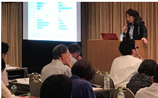
冬季は来年1月～3月内で全国各地で開催予定

http://www.jee.or.jp/workshop/workshop.html